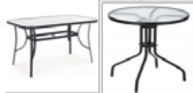
Havebord m/glasplade, der ikke ligger løs