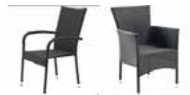
Havestole med flet